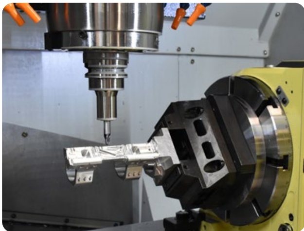
Komplexe Geometrien effizient gefertigt: Dank abgestimmter Werkzeuge und durchdachter Bearbeitungsstrategien ermöglicht Wedco wirtschaftliche Lösungen auf modernsten 5-Achs-Bearbeitungszentren.